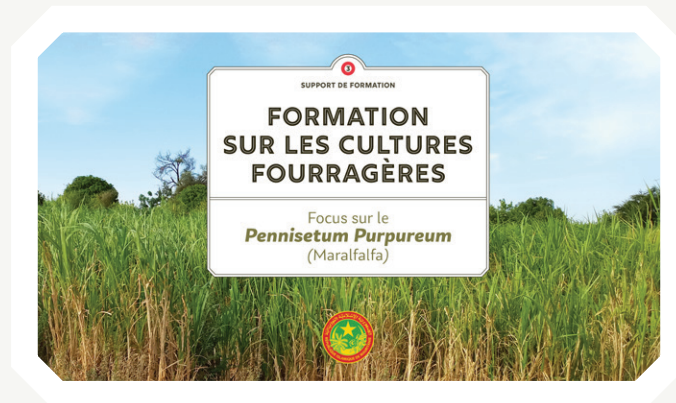
SUPPORT DE FORMATION (PRÉSENTATION POWERPOINT)